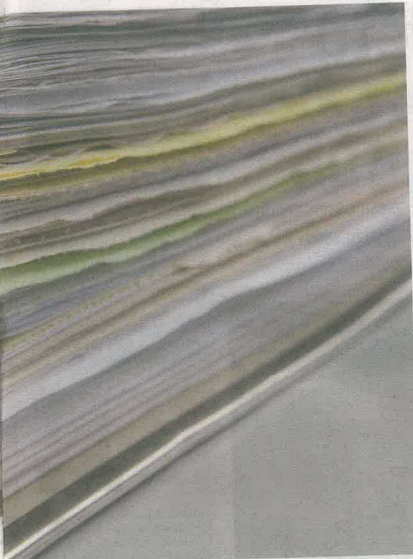
prilygino makulatūros krūvai